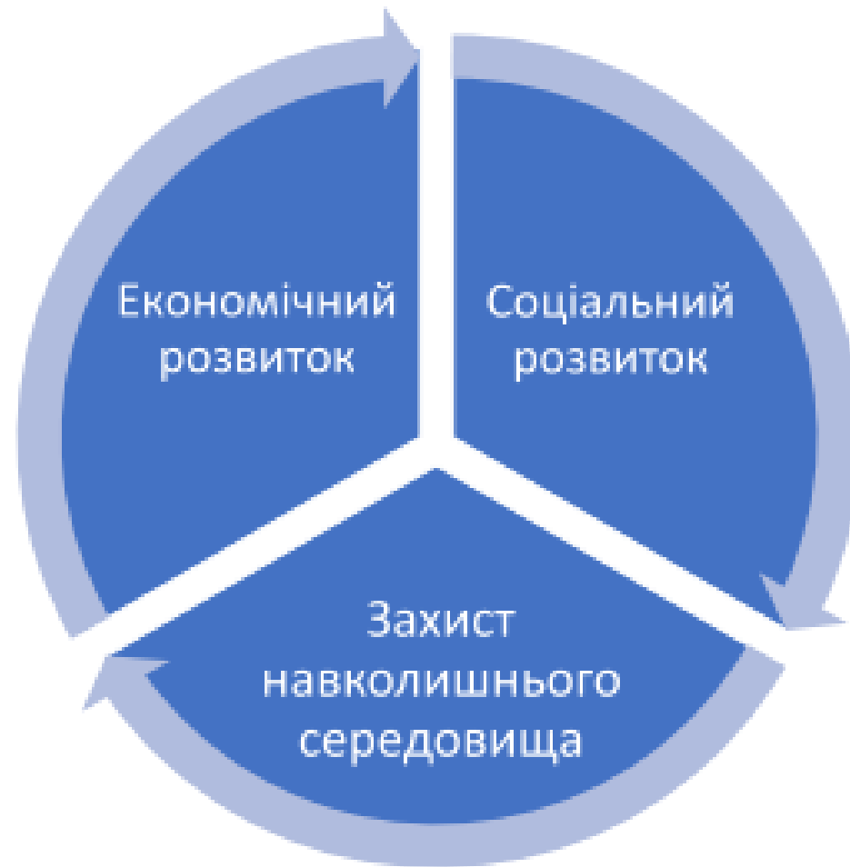
Складові компоненти стратегії регіонального розвитку